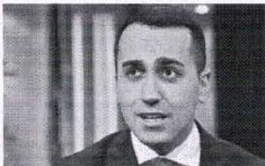
Aos 31 anos, o napolitano Luigi Di Maio, o gigi, que ficou famoso com o site de protesto contra a corrupção, se consolidou como novo líder europeu

metéorica. Sempre vestido de forma elegante, o candidato oficial do M5E a primeiro-ministro é, desde 2013, vice-presidente da Câmara dos Deputados, o mais jovem da história da Itália. Com um estilo bem diferente daquele do irreverente humorista Beppe Grillo, o fundador do movimento famoso por suas vulgaridades, Di Maio é a nova estrela da sigla, que conquistou a simpatia de boa parte dos italianos farristas da corrupção e dos privilegiados da classe política. A boca de urna mostrou o M5E, considerado um partido populista, de protesto, antissistema, com 29% a 32% dos votos. Para governar sozinho, a sigla precisaria de 40%. Como não alcançou o topo, terá de fazer coalizão com o líder da oposição. Em menos de dois anos, mesmo sem experiência, ou título universitário, Gigi escalou rapi-