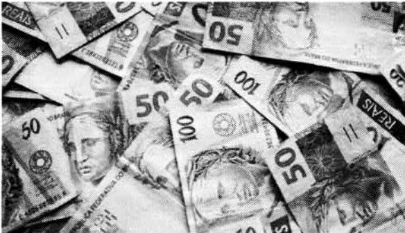
Preferência às notas de 50, especialmente, quando as compras têm valor de até R$ 10,00, segundo indicou a pesquisa do Banco Central divulgada na manhã de ontem (19)