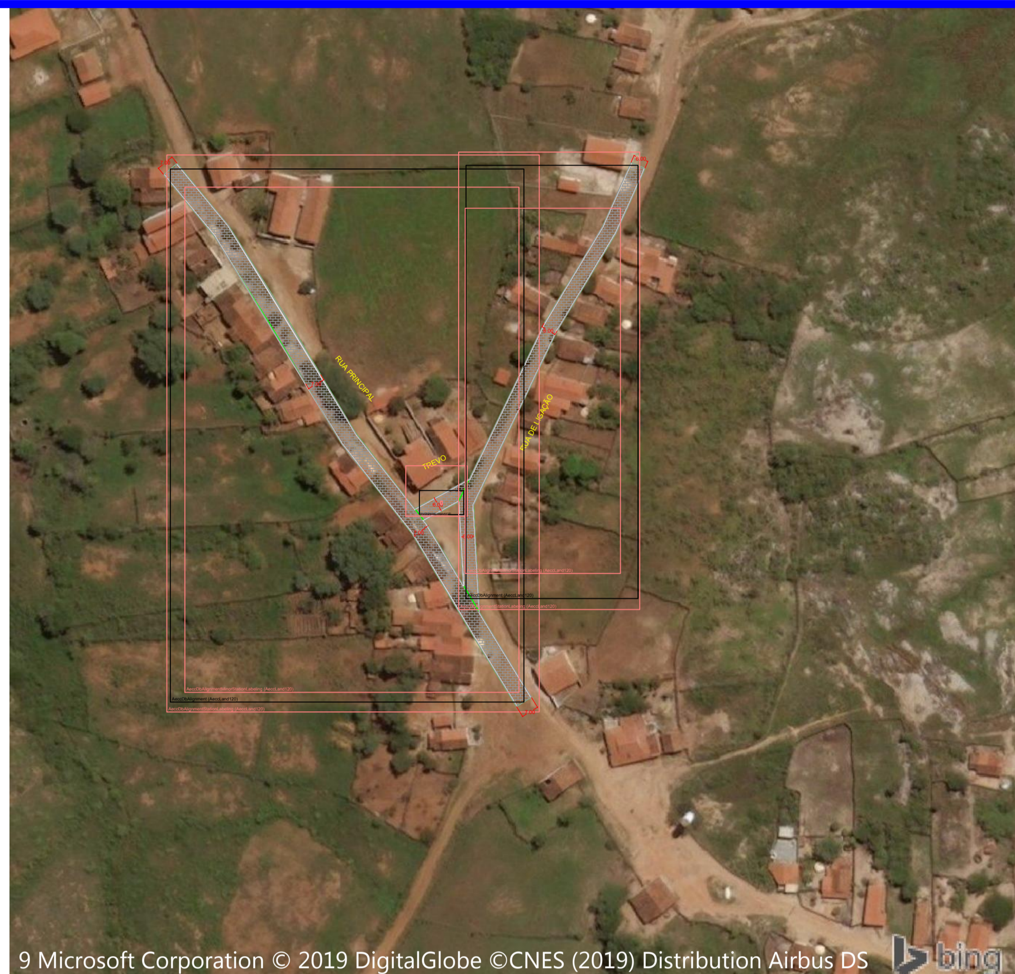
ALFERES ESCALA: 1/1500