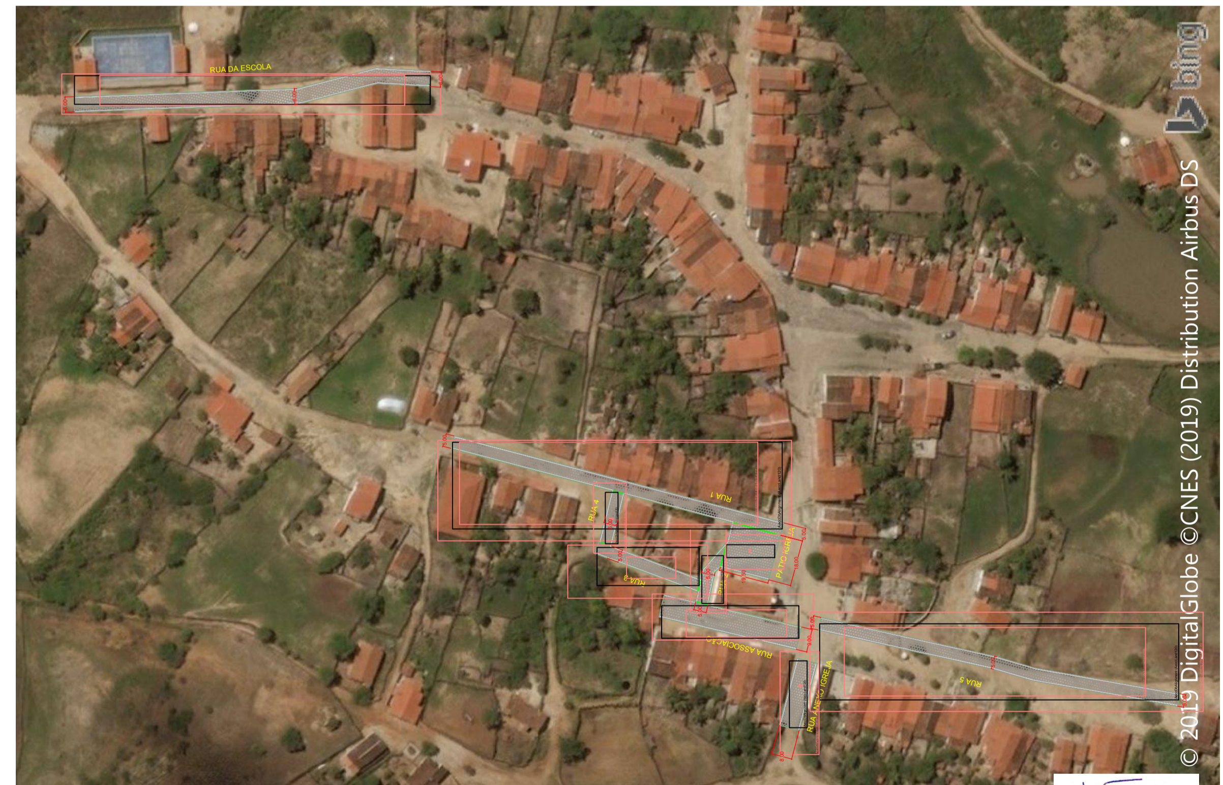
SÃO JOAQUIM ESCALA: 1/1500