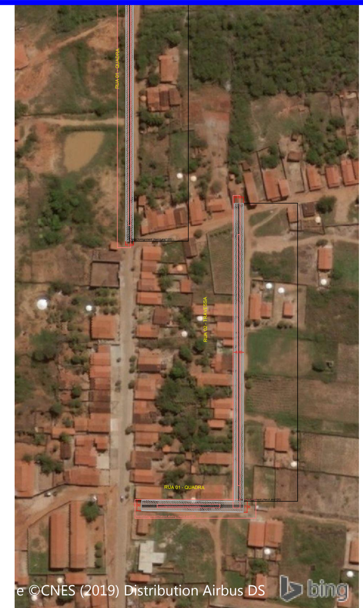
KM 27 ESCALA: 1/1500

9