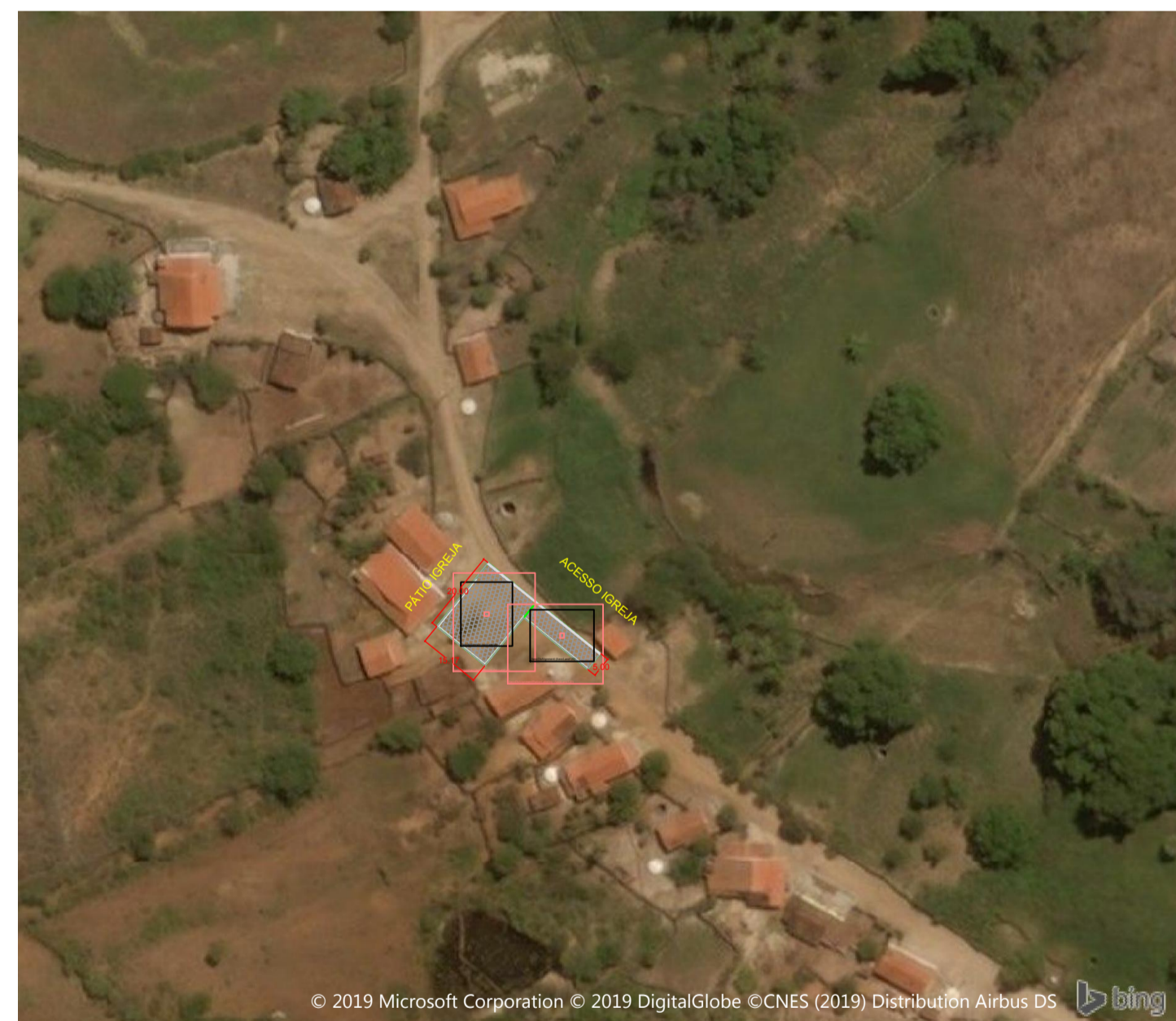
SÃO JOAQUIM ESCALA: 1/1500