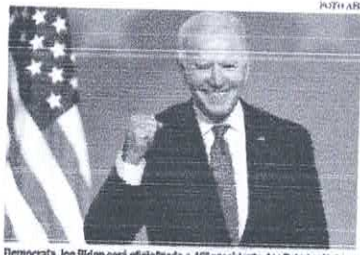
Democrata Joe Biden será oficializado o 46º presidente dos Estados Unidos

TEMPO EM FORTALEZA Min 27°C Max 29°C Tempo em Brasília (Máxima) São Paulo 28°C - Brasília 22°C - Rio 26°C MARÉ • ALTA 05:03 BAIXA 18:50 17:14 2.80m - 2.830 -0.02m