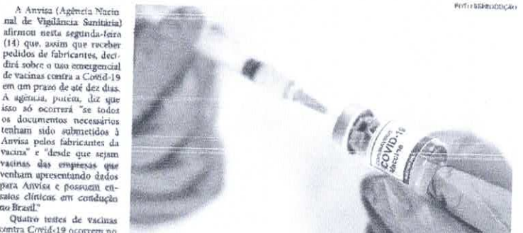
Quatro testes de vacinas contra Covid-19 ocorrem no país, e os resultados são bastante promissores

Anvisa afirmou que, assim que receber pedidos de fabricantes, decidirá sobre o uso emergencial de vacinas contra a Covid-19 em até dez dias