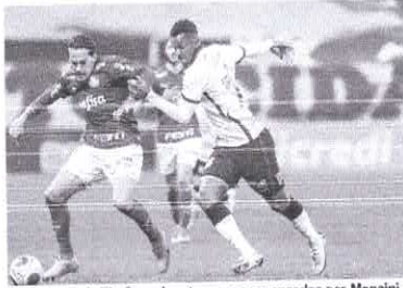
Os titulares do Timão podem ter vagas repensadas por Mancini

Após o jogo, o lateral Fábio Santos, inclusive, revelou que os jogadores ficaram o inverso de tudo o que foi pedido por Mancini. "Na verdade, não tirando o mérito do Palmeiras, óbvio fez por merecer os 4 a 0, mas o primeiro tempo, tudo que o Mancini pediu para gente, fizemos ao contrário", disse. Além de expor a fragilidade tática, a derrota para o arquirrival ameaça o rótulo de titulares absolutos de alguns jogadores na "era Mancini", casos de Gabriel e Jô principalmente, além de