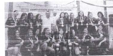
FUTSAL O futsal feminino também cresce no Ceará.

Esse é um concurso de palpíte que já ganhou a credibilidade de todos os cearenses. Um dos maiores do nosso estado, com a garantia da Loteria Estadual do Ceará. Loteria dos Sonhos é sucesso total.