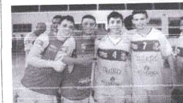
CRAQUES Um grupo só de craques do nosso futsal.