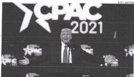
"Eles [democratas] perderam a Casa Branca em novembro", voltou a protestar o ex-presidente dos EUA

Ridicularizou o democrata por ter dito que não tinha encontrado estoque de vacinas ao chegar à Casa Branca. Mas disse que Biden não deveria