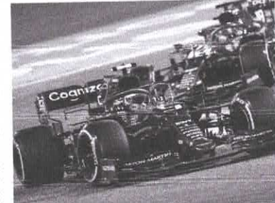
Corrida ficou marcada pelo novo recorde de Hamilton, com 5.112 voltas na liderança

Na 40ª volta, Verstappen, que largou na primeira colocação do grid, parou pela segunda vez para colocar pneus brancos, sendo ultrapassado por Hamilton, que já havia realizado suas duas paradas. Na reta final de corrida, Verstappen chegou a passar Hamilton e, quando parecia que venceria, teve um problema no seu carro, sendo passado novamente por Hamilton, que ficou na frente por 88,8. A