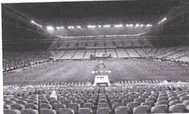
Inicialmente o período de restrição iria até o dia 30 de março, mas com os números da pandemia um prorrogação foi decidido pelo o estado

O período de prorrogação, entre os dias 3 de março e 11 de abril, compreende mais três rodadas do Paulista pela programação inicial da federação. A medida posterga também o retorno dos eventos esportivos no estado, incluindo jogos de futebol profissional. A Federação Paulista de Futebol (FPF)