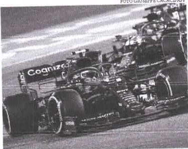
Corrida ficou marcada pelo novo recorde de Hamilton, com 5.112 voltas na liderança

Atual campeão, o inglês Lewis Hamilton (Mercedes) venceu o Grande Prêmio do Bahrein, realizado na manhã de ontem. Completaram o pódio Max Verstappen (Red Bull) e Valtteri Bottas (Mercedes). A corrida também ficou marcada pelo novo recorde alcançado por Hamilton, com 5.112 voltas na liderança, superando Michael Schumacher, que tem 5.111.