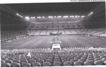
Inicialmente o período de restrição iria até o dia 30 de março, mas com os números da pandemia um prorrogação foi decidido pelo o estado

A prorrogação até 11 de abril da Fase Emergencial, - mais restritiva do Plano São Paulo, que busca conter a disseminação do novo coronavírus (covid-19) - vai impactar as três divisões do Campeonato Paulista. O anúncio desta sexta-feira (26) foi feito pelo vice-governador, Rodrigo Garcia, que não citou nominalmente o esporte. "Em virtude dos números da pandemia e da insistência do crescimento da pandemia, apesar de todas as medidas adotadas, o governo de São Paulo prorrogou até o dia 11 de abril a fase emergencial", afirmou ele no Palácio dos Bandeirantes.