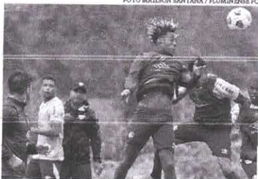
Os jogadores do tricolor do Rio vão enfrentar o River Plate no Maracanã hoje

O clube nunca foi derrotado nas estreias da competição. Trata-se da 7ª participação do Fluminense no maior torneio de clubes das Américas