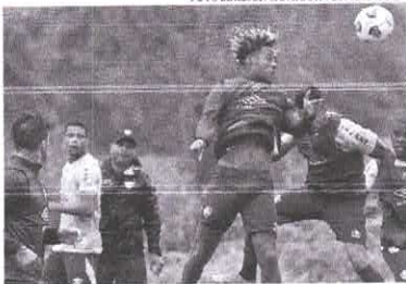
Os jogadores do tricolor do Rio vão enfrentar o River Plate no Maracanã hoje

Em 1971 e 1985, o Fluminense enfrentou brasileiros na fase de grupos, estreando contra Palmeiras e Vasco, respectivamente. Na primeira ocasião, venceu os alviverdes, mas deixou a competi-