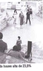
permercados e supermercados perdeu fôlego por causa das medidas de segurança

Com a reabertura de lojas, a maior parte das atividades voltou a ter alta nos negócios, enquanto a movimentação ficou menor nos hipermercados e supermercados. Foi uma espécie de substituição do consumo. “A atividade de hi-