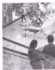
Em relação a abril do ano passado houve alta de 23,8%

Em 12 meses, o comércio varejista acumulou avanço de 3,6%. No acumulado deste ano, o setor registra alta de 4,5%. Cristiano dos Santos, gerente da pesquisa do IBGE, ressaltou que o crescimento em abril teve ligação com o menor nível de restrições a empresas e consumidores na comparação