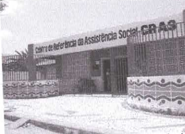
Famílias poderão buscar o Cras em sua região para fazer a inscrição

A tarifa da energia elétrica está mais cara a partir dessa quarta-feira (1º/09), mas não para todos os brasileiros. Cerca de 12 milhões de clientes residenciais no país não terão as contas de luz reajustadas. São aqueles consumidores beneficiários da tarifa social e que, de acordo com a Agência Nacional de Energia Elétrica (Aneel), não foram enquadrados na nova bandeira tarifária de escassez hídrica. Esse tipo de benefício só é destinado a clientes em situação de vulnerabilidade social e que estejam inscritos no Cadastro Único (CadÚnico) do governo federal, e que tenham renda familiar por pessoa de até meio salário mínimo, ou seja, o equivalente a R$ 550 por mês. Também têm direito à tarifa social as pessoas que recebem o Benefício de Prestação Continuada (BPC), que é destinado a idosos com mais de 65 anos ou deficientes em situação de miserabilidade. A tarifa social, no entanto, também pode ser requisitada por cidadãos inscritos no CadÚnico com renda mensal de até três salários mínimos, o equivalente a R$ 3.300 que tenham na família pessoas com doenças ou deficiências cujo tratamento médico depende de equipamentos que demandem consumo de energia elétrica.