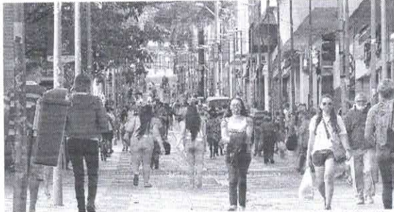
Maior renda média foi registrada em Florianópolis (R$ 2.129), e menor, em São Luís (R$ 699)

Na visão dos responsáveis pela pesquisa, os dados deixam claro que a atividade econômica e o mercado de trabalho ainda não ganharam a tração desejada nas regiões metropolitanas. O segundo trimestre de 2021 fez o sexto consecutivo de queda na média de rendimentos. Conforme o boletim, os mais pobres perderam mais renda, em termos relativos, durante a pandemia. Nessa camada, até houve um esboço de melhoria nos últimos trimestres, mas ainda distante de reverter