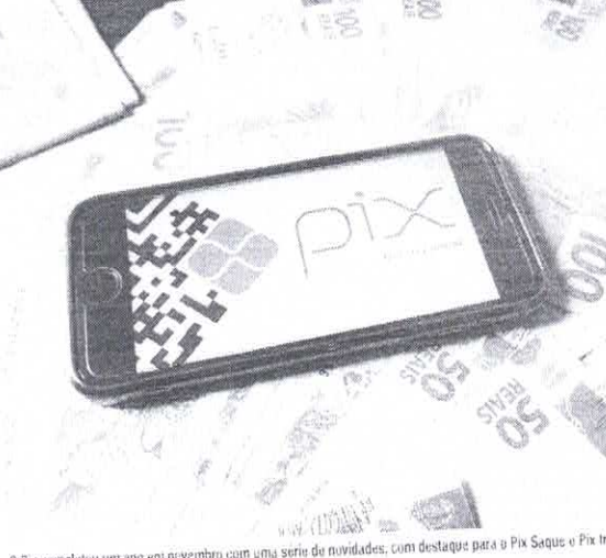
O Pix completou um ano em novembro com uma série de novidades, com destaque para o Pix Saque e Pix Troca

Segundo o presidente do BC, Roberto Campos Neto, há pelo menos outras duas novidades que o Pix deve ter em