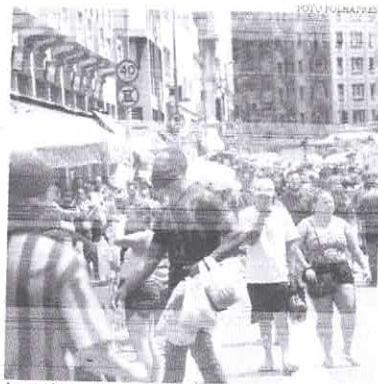
Apesar de a pandemia ter atingido todas as economias, o Brasil teve retração maior que a média global em 2020

O Produto Interno Bruto (PIB) brasileiro cresceu 1,4 ponto percentual abaixo da média global desde 1987, período estudado pelos pesquisadores da FGV. Na média, o país cresceu 2% ao ano, enquanto o mundo avançou