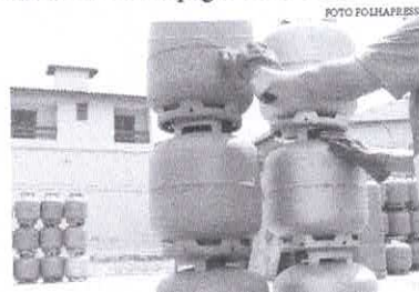
Segundo a Petrobras, medida se justifica pelos efeitos da situação excepcional e de emergência decorrentes da pandemia da covid-19

Só em 2021, o preço médio do botijão de 13 quilos subiu 30%. O cenário vem levando famílias de baixa renda a optar por lenha ou carvão para cozinhar. Para custear o benefício do vale-gás, serão utilizados os dividendos pagos pela Petrobras à União, em parcelas dos royalties devidos à União em função da produção de petróleo, de gás natural e de outros hidrocarbonetos fluidos sob o regime de partilha de produção e o bônus de assinatura nas licitações de áreas para a exploração de petróleo e de gás natural.