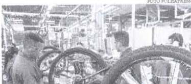
A expansão da indústria geral foi puxada pela produção de veículos automotores, reboques e carrocerias, que subiu 12,2%

O desempenho de dezembro de 2021 surpreendeu o mercado financeiro, que projetava avanço de 1,6% frente ao mês de novembro