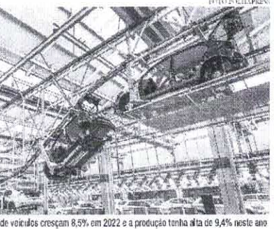
Previsão da Anfavea é de que as vendas de veículos cresçam 8,5% em 2022 e a produção tenha uma alta de 9,4% neste ano

Na contramão da falta de insumos em razão da pandemia, a produção de veículos aumentou 11,6% em 2021. Os dados são da Associação Nacional de Fabricantes de Veículos Automotores (Anfavea). No total, segundo a Associação, foram fabricadas 2,24 milhões de unidades, enquanto em 2020 as montadoras produziram 2,01 milhões de veículos. Somente em dezembro a produção teve leve alta (0,8%) em relação ao mesmo mês de 2020, com a montagem de 210,9 mil unidades. "A gente conseguiu puxar a produção em dezembro, trazendo peças, falando com fornecedores, ligando para as nossas matrizes para disponibilizarem semicondutores, de tal forma que a gente pudesse entregar o máximo possível para atender a fila de espera", disse o presidente da Anfavea, Luiz Carlos Moraes, ao salientar que os números foram possíveis porque as montadoras fizeram um esforço para contornar os problemas enfrentados nos últimos meses com a falta de componentes em todo o mundo. As vendas tiveram alta de 3% ao longo do ano passado, com a comercialização de 2,12 milhões de unidades. Em dezembro, no entanto, foi registrada uma queda de 15,1% nas vendas em relação ao mesmo mês de 2020,