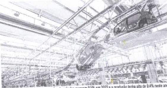
Previsão da Anfavea é de que as vendas de veículos cresçam 8,5% em 2022 e a produção tenha alta de 9,4% neste ano

As vendas tiveram alta de 3% ao longo do ano passado, com a comercialização de 2,12 milhões de unidades. Em dezembro, no entanto, foi registrada uma queda de 15,1% nas vendas em relação ao mesmo mês de 2020,