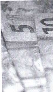
As contribuições para o INSS, microempreendedores individuais têm direito à aposentadoria por idade, auxílio-doença, entre outros

No Brasil, os microempreendedores individuais são profissionais autônomos com regime tributário e previdenciário simplificado. Eles recebem 5% do salário mínimo por mês para o Instituto Nacional de Seguro Social (INSS). O restante da contribuição mensal varia conforme o ramo de atuação. Este é o caso da pequena empresa Rosa de Lima. Ela atua no ramo de vendas de vestuário feminino e não aprovou o aumento. "Neste momento de ainda pandemia em que não conseguimos ter o volume de vendas considerado bom, além de outros aumentos como já sabemos, ainda teremos mais esse. Não é um valor absurdo,