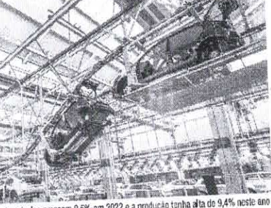
Previsão da Anfavea é de que as vendas de veículos cresçam 8,5% em 2022 e a produção tenha alta de 9,4% neste ano

Já a produção de caminhões teve alta de 74,6% em 2021. Foram fabricadas ao