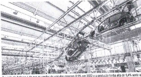
Previsão da Anfavea é de que as vendas de veículos cresçam 8,5% em 2022 e a produção tenha alta de 9,4% neste ano

Na contramão da falta de insumos em razão da pandemia, a produção de veículos aumentou 11,6% em 2021. Os dados são da Associação Nacional de Fabricantes de Veículos Automotores (Anfavea). No total, segundo a Associação, foram fabricadas 2,24 milhões de unidades, enquanto em 2020 as montadoras produziram 2,01 milhões de veículos. Somente em dezembro a produção teve leve alta (0,8%) em relação ao mesmo mês de 2020, com a montagem de 210,9 mil unidades. "A gente conseguiu puxar a produção em dezembro, trazendo peças, ligando para fornecedores, ligando para as nossas matrizes para disponibilizar o semi-rodutivos, de tal forma que a gente pudesse entregar o máximo possível para atender a fila de espera", disse o presidente da Anfavea, Luiz Carlos Moraes, ao salientar que os números foram possíveis porque as montadoras fizeram um esforço para contornar os problemas enfrentados nos últimos meses com a falta de componentes em todo o mundo. As vendas tiveram alta de 3% ao longo do ano passado, com a comercialização de 2,12 milhões de unidades. Em dezembro, no entanto, foi registrada uma queda de 15,1% nas vendas em relação ao mesmo mês de 2020,