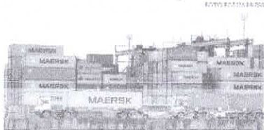
Embora a participação nas exportações tenha recuado 1,1%, a China continua liderando exportações e importações brasileiras

Os principais produtos importados foram gás natural liquefeito (GNL) e óleo cru de petróleo. Destaque