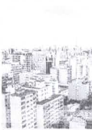
A renda mínima necessária para conseguir um financiamento imobiliário vem subindo, o que pode dificultar a compra

Mas é o segmento popular que domina as vendas, segundo a Abrainc. As unidades relacionadas ao programa Casa Verde e Amarela, o antigo Minha Casa, Minha Vida, foram 57,9% dos lançamentos e 80,2% de todos os imóveis comercializados, com 113.008 unidades, patamar estável em relação a 2020. Os lançamentos de