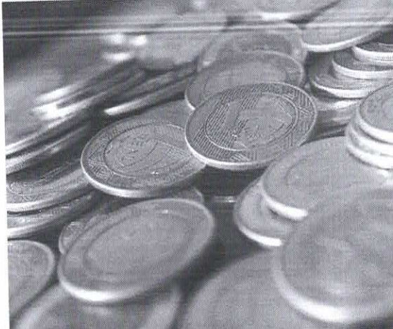
Arrecadação do IOF aumentou R$ 945 milhões, 26,26% acima da inflação em fevereiro deste ano, se comparado ao mesmo mês de 2021

Um dos fatores que têm impulsionado os números foi o recolhimento de Imposto de Renda Pessoa Jurídica (IRPJ) e de Contribuição Social sobre o Lucro Líquido (CSLL), mesmo não sendo repetido em fevereiro deste ano. No mesmo mês do ano passado (2021), o governo registrou recolhimento de R$ 5 bilhões em IRPJ e CSLL. No entanto, mesmo em esse reforço, os recolhimentos atípicos continuam a impulsionar a arrecadação no primeiro bimestre. Em janeiro e fevereiro, esse tipo de receita