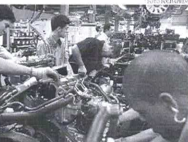
Entre os segmentos que mais contrataram em fevereiro estão os serviços (215,4 mil) e a indústria (43 mil)

Além disso, após crescimento em janeiro os salários de admissão voltaram a cair. Agora, a remuneração média para quem foi contratado em fevereiro foi de R$ 1.878,66, 3% menos do que em janeiro. Nesse cenário, o aumento nos pedidos de seguro-desemprego chegaram a 550,2 mil em fevereiro, 4% mais do que em janeiro e