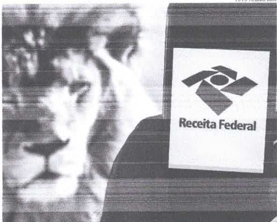
Estão obrigados a entregar a Declaração de Ajuste Anual contribuintes que tiveram, em 2021, rendimentos tributáveis acima de R$ 28.559,70

Neste ano, a Receita apresentou algumas novidades na declaração do IRPF 2022, entre as quais o acesso ampliado à declaração pré-preenchida por meio de todas as plataformas disponíveis, além do recebimento da restituição e o pagamento de Darf via Pix, desde que a chave do contribuinte seja o CPE. Além disso, também será possível declarar online ou por dispositivos móveis, por meio do app Meu Im-