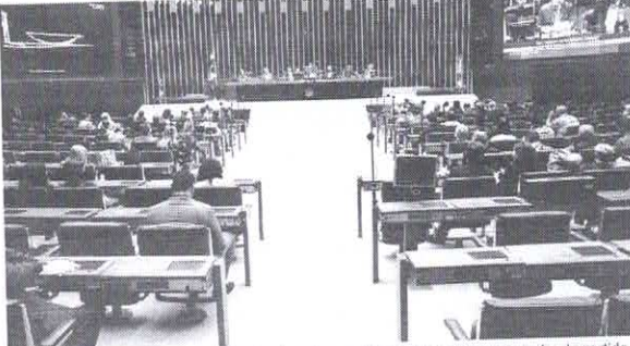
Parlamentares da sigla na Câmara Federal cogitam pedir aval da Justiça para mudar de partido

O grupo, porém, se divide entre os "bolsonaristas raiz", ligados ao ex-presidente e com