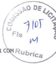
TABELA: SEINFRA 027.1 E SINAPI 2022/11 COM Rubrica DESONERAÇÃO BDI: 28,35%