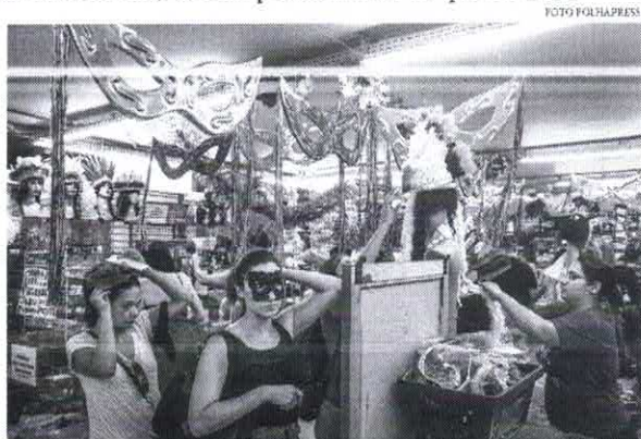
Carnaval de 2023 deve gerar novos postos de trabalho em diversos segmentos do mercado, principalmente o turismo