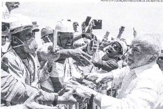
Com nome utilizado nos governos petistas, o novo programa será lançado na semana que vem e exigirá contrapartida das famílias

O ministro do Desenvolvimento e Assistência Social, Família e Combate à Fome,