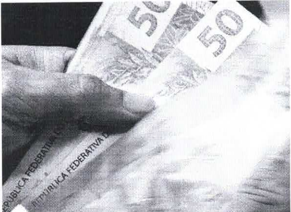
O novo valor deve entrar em vigor em 1º de maio, Dia Internacional do Trabalho. Atualmente, o mínimo é de R$ 1.302

O presidente disse ainda que o mínimo terá, além da reposição inflacionária, o crescimento do PIB. 'Porque é a forma mais justa de evitar distribuir o crescimento da economia. Não adianta o PIB crescer 14% e você não distribuir. É importante que ele cresça 5%, 6%, 7% e você distribua para a sociedade. Nos vamos aumentar o salário mínimo todo ano de acordo com a inflação, será restará, e o crescimento do PIB será colocado