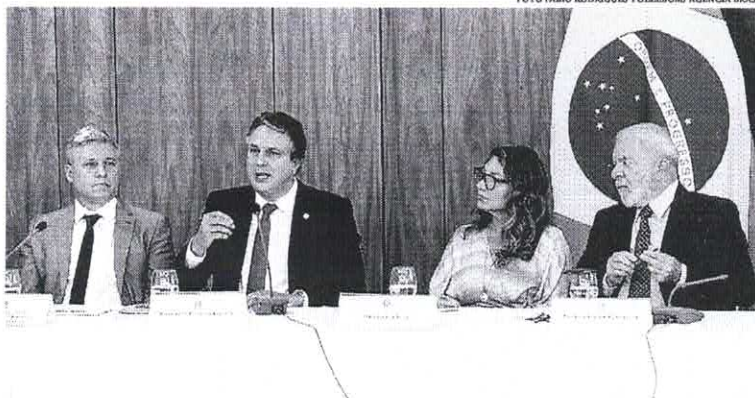
Ministro do MDA, Paulo Teixeira, ministro da Educação, Camilo Santana, primeira-dama Janja e o presidente Lula, durante lançamento

Plataforma vai mapear obras paradas nos estados e municípios, gestores terão até 10 de abril para atualizar informações no sistema