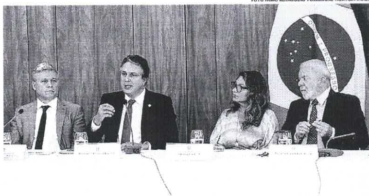
Ministro do MDA, Paulo Teixeira, ministro da Educação, Camilo Santana, primeira-dama Janja e o presidente Lula, durante lançamento

Plataforma vai mapear obras paradas nos estados e municípios, gestores terão até 10 de abril para atualizar informações no sistema