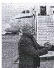
A viagem à China será o quarto compromisso internacional de Lula em seu terceiro mandato

Nesta terça-feira, 11, o presidente do Brasil, Luiz Inácio Lula da Silva embarcou em direção à China. A viagem deveria ter acontecido no final de março, porém, precisou ser adiada após Lula ter sido diagnosticado com um quadro de pneumonia. Antes de embarcar, o presidente repassou o comando do país para o vice, Geraldo Alckmin, que o acompanhou até a Base Aérea de Brasília. "China e Brasil compartilham desafios de desenvolvimento comuns e podem ampliar muito mais seu comércio e investimentos", escreveu Alckmin em publicação feita nas redes sociais.