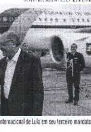
A viagem à China será o quarto compromisso internacional de Lula em seu terceiro mandato