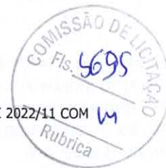
TABELA: SEINFRA 027.1 E SINAPI 2022/11 COM W DESONERAÇÃO BDI: 28,35%