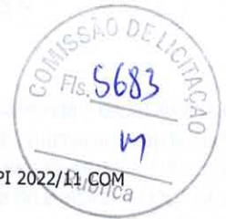
TABELA: SEINFRA 027.1 E SINAPI 2022/11 COM DESONERAÇÃO BDI: 28,35%