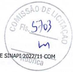
TABELA: SEINFRA 027.1 E SINAPI/2022/11 COM DESONERAÇÃO BDI: 28,35%

OBRA: AMPLIAÇÃO E REFORMA DA EEIEF PEDRO HOLANDA LOCAL: SÍTIO JENIPAPEIRO - SENADOR POMPEU/CE REF.: TOMADA DE PREÇOS Nº SE-TP003/2023 RAZÃO SOCIAL: CLEZINALDO S. DE ALMEIDA CONSTRUÇÕES - EPP CNPJ: 22.575.652/0001-97