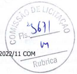
TABELA: SEINFRA 027.1 E SINAPI 2022/11 COM DESONERAÇÃO BDI: 28,35%