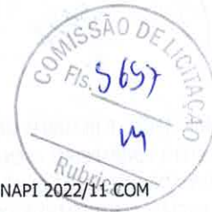
TABELA: SEINFRA 027.1 E SINAPI 2022/11.COM DESONERAÇÃO BDI: 28,35%