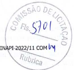
TABELA: SEINFRA 027.1 E SINAPI-2022/11 COM VM DESONERAÇÃO BDI: 28,35%