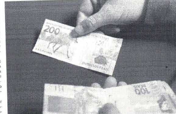
A renegociação contempla dívidas com cartão de crédito, consignado, cheque especial, empréstimo pessoal e outras modalidades

Inadimplente Segundo dados da Confederação Nacional de Dirigentes Lojistas (CNDL) e do Serviço de Proteção ao Crédito (SPC), divulgados em janeiro, o Brasil tem cerca de 65,1 milhões com dívidas em atraso. Outro levantamento da Confederação Nacional de