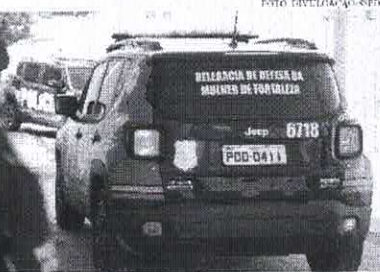
Entrou à última sexta-feira e domingo, 18 pessoas foram presas por suspeita de violência contra a mulher