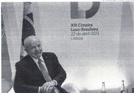
Em sua primeira viagem à Europa neste mandato, Lula cumpre agenda em Portugal e na Espanha

Para Lula, é preciso construir uma narrativa que convença Vladimir Putin e Volodymyr Zelensky de que a guerra não é a melhor saída para resolver os problemas. Previamente, em uma