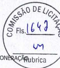
TABELA: SEINFRA 027.1 E SINAPI 2023/04 COM DESONERAÇÃO BDI: 28,35%

OBRA: CONSERVAÇÃO E MANUTENÇÃO DA EEF GERALDO JÚNIOR LOCAL: BAIRRO BRASÍLIA, SENADOR POMPEU - CE REF.: TOMADA DE PREÇOS Nº SE-TP007/2023 RAZÃO SOCIAL: CLEZINALDO CONSTRUÇÕES LTDA - EPP CNPJ: 22.575.652/0001-97