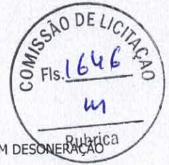
TABELA: SEINFRA 027.1 E SINAPI 2023/04 COM DESONERAÇÃO BDI: 28,35%

OBRA: CONSERVAÇÃO E MANUTENÇÃO DA EEF GERALDO JÚNIOR LOCAL: BAIRRO BRASÍLIA, SENADOR POMPEU - CE REF.: TOMADA DE PREÇOS Nº SE-TP007/2023 RAZÃO SOCIAL: CLEZINALDO CONSTRUÇÕES LTDA - EPP CNPJ: 22.575.652/0001-97