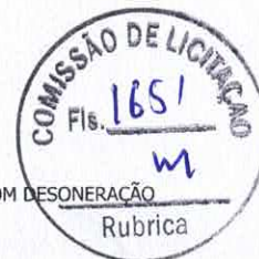
TABELA: SEINFRA 027.1 E SINAPI 2023/04 COM DESONERAÇÃO BDI: 28,35%

OBRA: CONSERVAÇÃO E MANUTENÇÃO DA EEF GERALDO JÚNIOR LOCAL: BAIRRO BRASÍLIA, SENADOR POMPEU - CE REF.: TOMADA DE PREÇOS Nº SE-TP007/2023 RAZÃO SOCIAL: CLEZINALDO CONSTRUÇÕES LTDA - EPP CNPJ: 22.575.652/0001-97