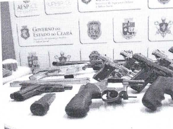
Autoridades indicam que a cada uma hora e 20 minutos, uma arma de fogo é apreendida no Ceará

A Secretaria de Segurança Pública e Defesa Social (SSPDS) divulgou nesta quinta-feira, 13, o balanço oficial sobre apreensão de armas de fogo no Ceará no mês de junho. Os dados da Superintendência de Pesquisa e Estratégia de Segurança Pública (Supesp) apontam que o estado aumentou suas apreensões em 26,4%, se comparado ao mesmo mês do ano passado. No total, 623 armas foram apreendidas no período. Os números referentes a Fortaleza representam aproximadamente 20% dessa quantidade. No último mês, as forças de segurança retiraram de circulação 137 armas de fogo na capital, o que corresponde a um aumento de 9,6% se comparado com o mesmo momento de 2022.