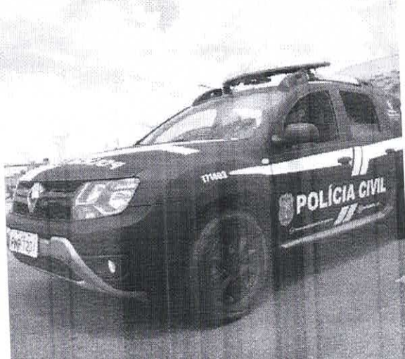
Os esforços da Operação Paz continuarão sendo desenvolvidos até o mês de dezembro