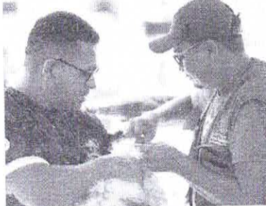
Além de proteger cães e gatos, a vacina ajuda a evitar a transmissão da doença para humanos

No ano passado, Fortaleza também conseguiu atingir a meta para cães determinada pelo Ministério da Saúde, de 80%, ao vacinar um total de 322.320 ani-