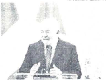
Nesta quinta-feira, Lula tem uma reunião marcada com o presidente Emmanuel Macron

Para fechar o acordo, a União Europeia está exigindo que o Brasil adote medidas mais rígidas quanto à questão ambiental. No encontro para Lula e para o ministro de Relações Exteriores, Mauro Vieira, as solicitações mais pesadas podem estar relacionadas às medidas protecionistas e podem ainda, colocar em risco o agronegócio brasileiro. "Essa proposta de acordo não