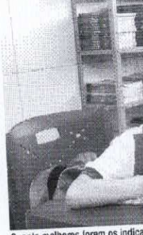
Quanto melhores forem os indicadores, maior a chance dos alunos garantirem uma boa educação