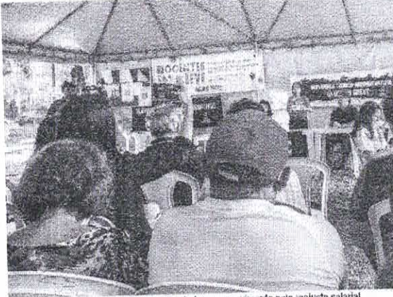
No Ceará, as três universidades federais aderiram ao movimento pelo reajuste salarial

Os professores das três universidades federais cearenses, isto é, da Universidade Federal do Ceará (UFC), da Universidade Federal do Ceará (UFCA) e da Universidade de Integração Interacional da Lusofonia Afro-Brasileira (Unilab), deram início nesta segunda-feira, 15, ao movimento de greve que segue uma mobilização nacional envolvendo docentes, técnicos administrativos e estudantes. De acordo com a Seção Sindical dos Docentes das Universidades Federais do Estado do Ceará (Adufec), a paralisação está relacionada com o reajuste salarial para 2024. O Instituto Federal do Ceará (IFCE) está com atividades suspensas desde o dia 11 de abril.