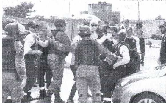
A PMCE informou que as equipes foram acionadas para desobstruir uma via no bairro Castelão

Na manhã desta segunda-feira, 22, os servidores do Departamento Estadual de Trânsito (Detran), que estão em greve há mais de 20 dias, se envolveram em um conflito com o Batalhão de Choque da Polícia Militar (PMCE). A situação aconteceu durante um protesto que estava ocorrendo em frente a Arena Castelão, em Fortaleza, e terminou com um dos manifestantes detido por desobediência.