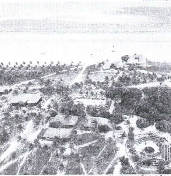
Um dos inquéritos tem como foco supostas irregularidades cometidas pela pousada Rancho do Peixe

Um dos inquéritos tem como foco supostas irregularidades cometidas pela pousada Rancho do Peixe. O Ministério Público averigua se o empreendimento possui