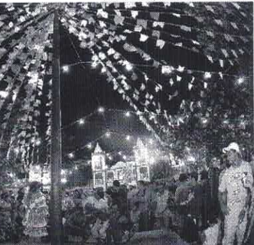
A expectativa da Prefeitura é que o evento atraia cerca de 500 mil pessoas para a Praia de Iracema

Após a polémica envolvendo a contratação da dupla Victor & Leo, que teve o show cancelado devido às críticas pelo fato do cantor Victor já ter sido condenado por ter agredido sua mulher em 2019, o prefeito informou, na última terça-feira, 18, que Xand Avião seria o substituto. "Determinamos a substituição da dupla Victor e Leo em nosso São João. Mesmo que os cachês dos artistas sejam pagos por patrocinadores, trata-se de