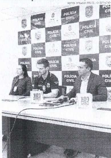
Informações foram repassadas em coletiva nesta quinta (8)